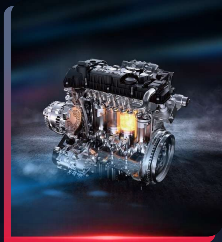
MOTOR 2.0 TURBO

La Jetour X90 PLUS es una SUV completa, gracias a su equipamiento de vanguardia que incluye un motor 2.0 turbo, proporcionando un rendimiento excepcional en todo tipo de rutas.