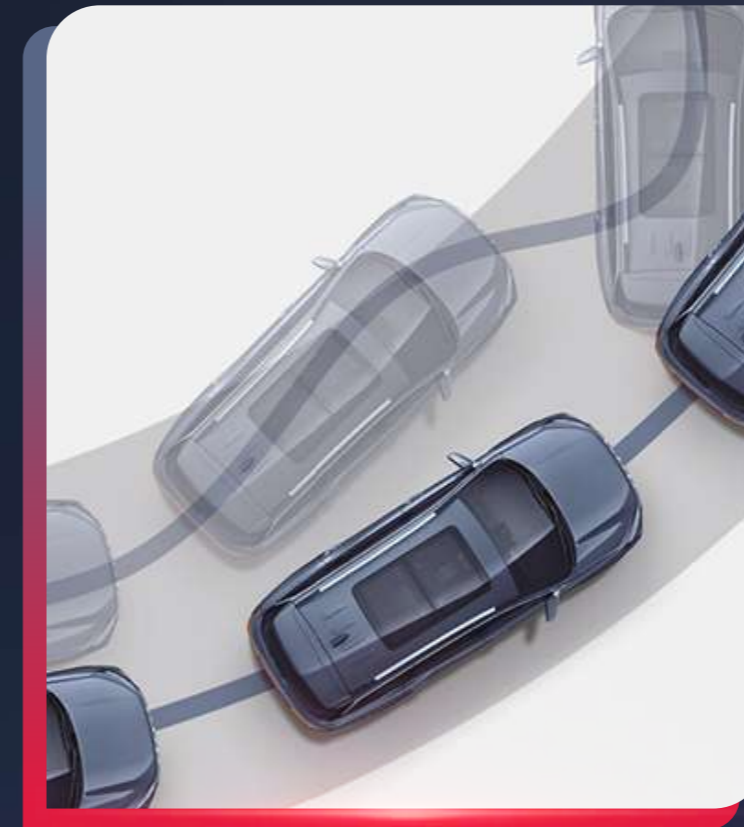
SISTEMA DE CONTROL DE ESTABILIDAD (ESP)