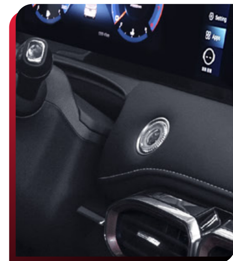
SMART KEY (BOTÓN DE ENCENDIDO)