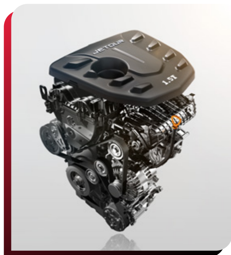
MOTOR 1.5 / 1.6 TURBO

Pon a prueba la resistencia de esta gran SUV