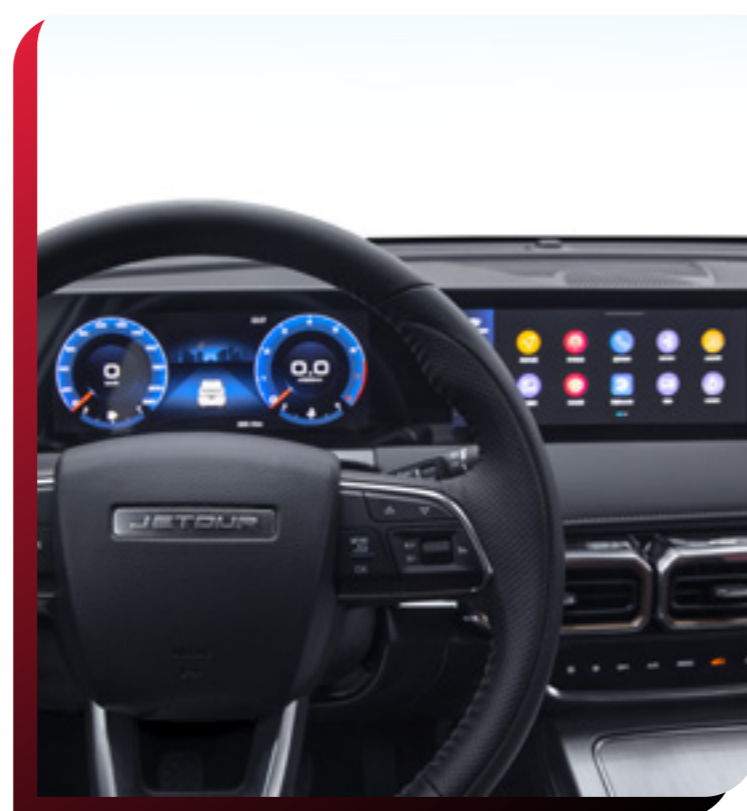
SISTEMA DE INFOENTRETENIMIENTO Y MIRROR LINK