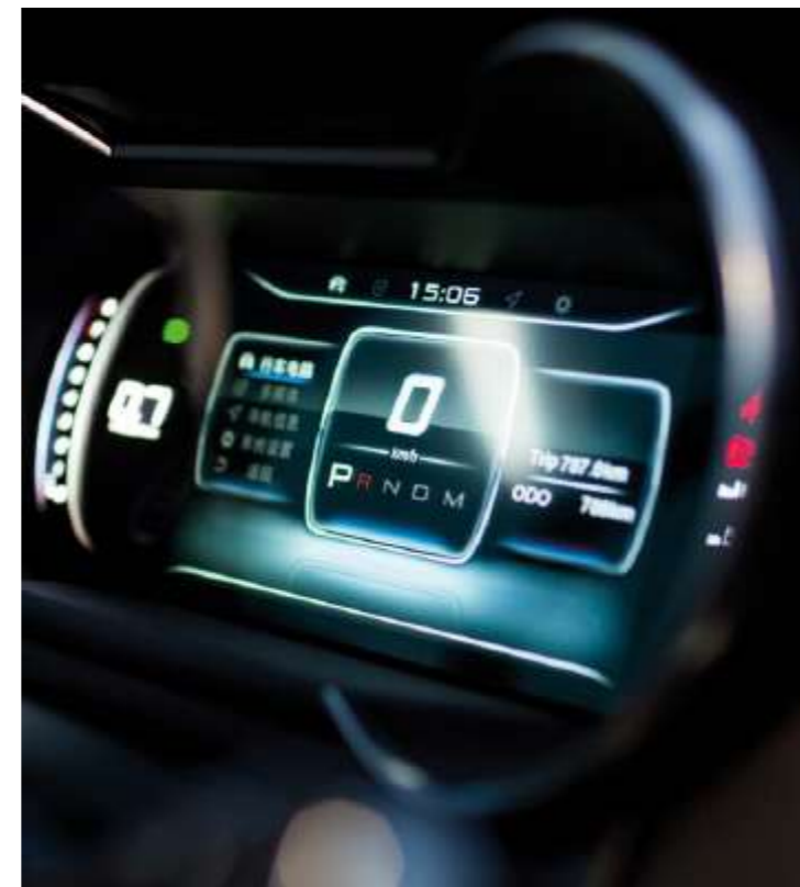
DIGITAL COCKPIT DE 12.3"