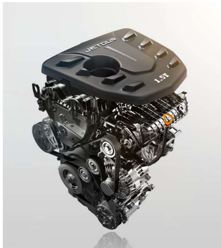
MOTOR 1.5 TURBO

Pon a prueba la resistencia de esta gran SUV