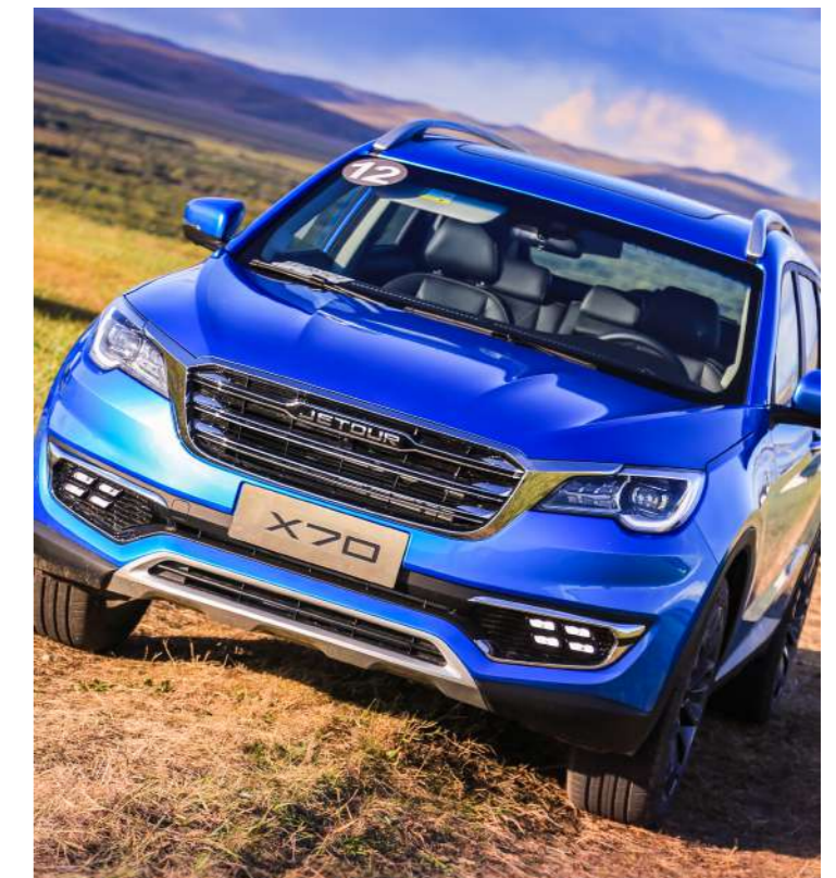
ABS + BAS + EBD + TCS + HSA + Autohold