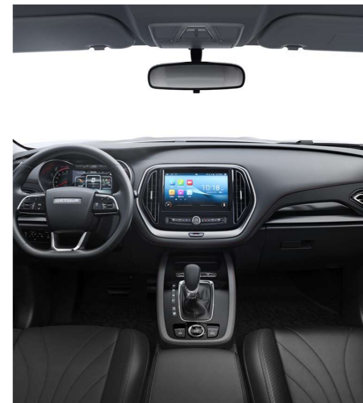
PANTALLA DE INFOENTRETENIMIENTO DE 10"